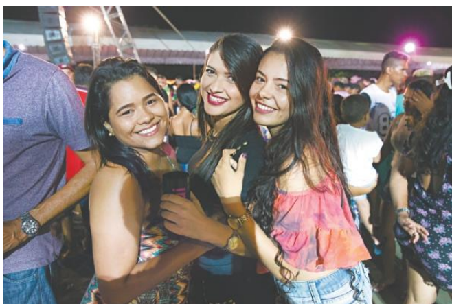
Festas foram abrilhantadas pela beleza dos foliões que aproveitaram cada momento

No sertão jaguaribano, o caminho das águas também foi o da alegria na barragem de Quixeré, banhada pelas águas do Rio Jaguaribe. Houve registro, por dia, de dez mil pessoas nas areias ribeirinhas.