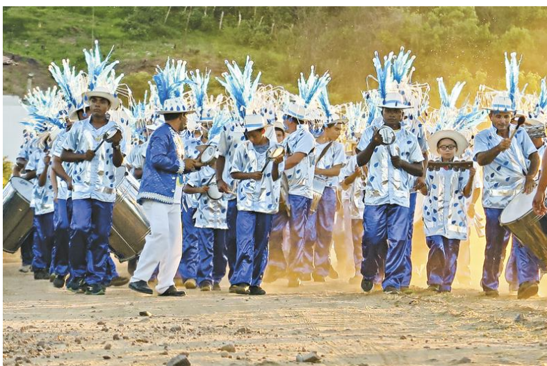
Tradicional escola de Várzea Alegre puxa o ritmo em cortejo do campo à cidade