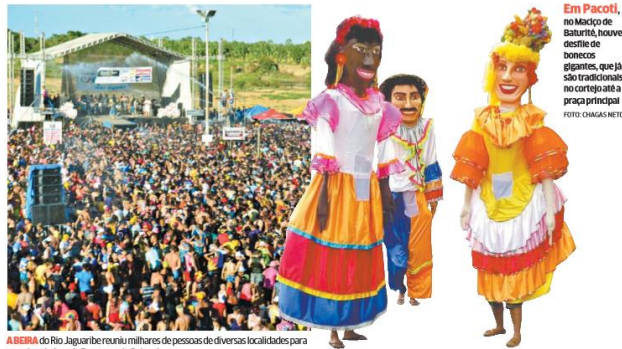
ABEIRA do Rio Jaguaribe reuniu milhares de pessoas de diversas localidades para apreciar a beleza da Barragem de Quixerê.

➔ Carnaval no Interior. Confira a galeria de imagens de festas carnavalescas no Sertão do Ceará, no link http://bit.ly/seraocentral