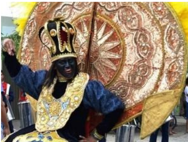
Carnaval de Senador Pompeu

Carnaval de Folias e Máscaras será realizado neste sábado (6). Iniciativa visa a valorização das tradições e festas populares.