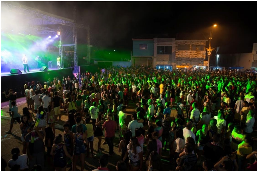
Festa no município de Granja (CE). Foto: Bruno Gomes.

Link: http://diariodonordeste.verdesmares.com.br/cadernos/regional/o-sertao-tem-samba-para-a-chuva-1.1488987