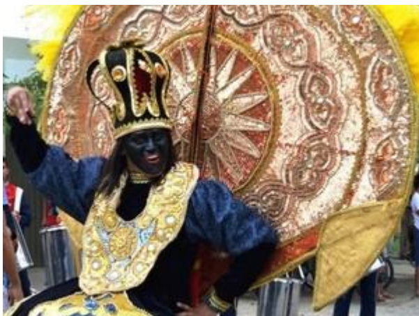
Carnaval de Senador Pompeu

O município de Senador Pompeu, localizado a 275 quilômetros de Fortaleza , realiza neste sábado (6) o tradicional Carnaval de Folias e Máscaras.