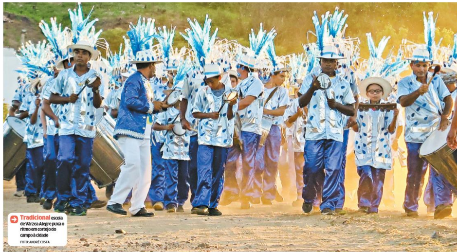
➔ Tradicional escola de Várzea Alegre puxa o ritmo em cortejo do campo à cidade.