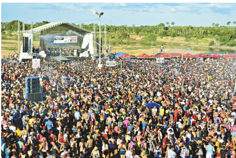
A Beira do Rio Jaguaribe reuniu milhares de pessoas de diversas localidades para apreciar a beleza da Barragem de Quixeré

Arrastando pé, levantando poeira e fazendo batuque, os agricultores da Escola de Samba Unidos do Roçado de Dentro saem do campo para a cidade acumulando brincantes por onde passam. Há 53 anos, o grupo esbanja cor e disposição no Carnaval em Várzea Alegre. Pelo direito ao banho de chuva (das pessoas, dos açudes e das plantas) a agremiação saiu com o tema "Água: fonte de vida".