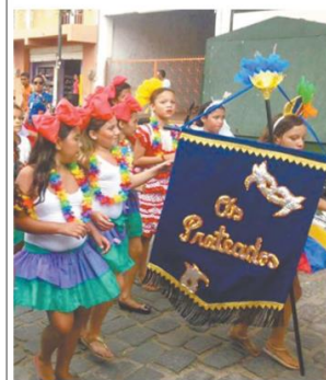
MARACATU. Carinê e escola de samba de Barbalha somaram cores e as emprestaram às ruas de Senador Pompeu. FOTO: ALEX PIMENTEL

➔ Bloco das Virgens, um dos mais tradicionais do Cariri, percorre 5 km ao som de dois trios elétricos pelas ruas do Crato. Vale pegar a roupa da mãe, da irmã ou da namorada. FOTO: ALEX PIMENTEL