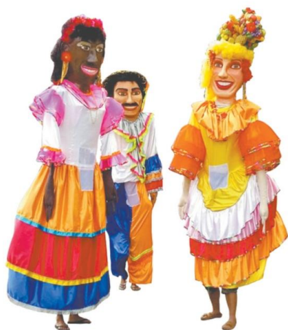
Em Pacoti, no Maciço de Baturité, houve desfile de bonecos gigantes, que já são tradicionais no cortejo até a praça principal

Granja, também na região Norte, foi animada com uma festa em praça pública. Além da própria Barragem Lima Brandão, sobre o Rio Coreaú, foram atrações na cidade bandas como Forró Real e as coleguinhas Simone e Simaria.