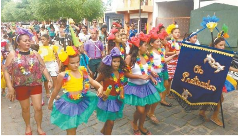
Maracatu - Canindé e escola de samba de Barbalha somaram cores e as emprestaram às ruas de Senador Pompeu