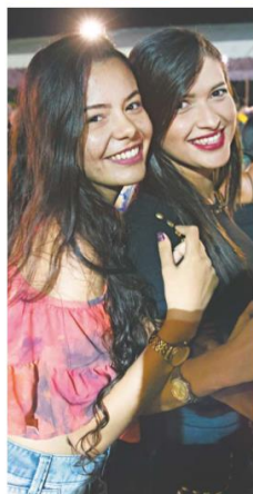
FESTAS foram abrilhantadas pela beleza dos foliões que aproveitaram cada momento.

Com ritmo e harmonia, agricultores replicam batuques celebrando a água. No Interior, sertão e serra foram só diversão