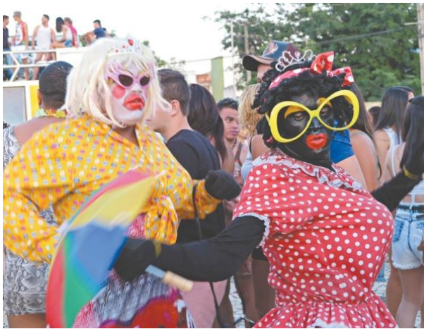
Tradição no Crato - Bloco das Virgens, um dos mais tradicionais do Cariri, percorre 5 km ao som de dois trios elétricos pelas ruas do Crato. Vale pegar a roupa da mãe, da irmã ou da namorada