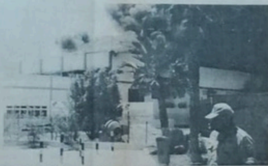
No dia do incêndio os moradores tiveram de abandonar suas casas.